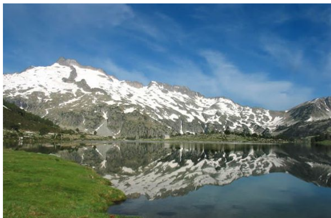
Le Néouvielle et le lac d'Aumar

Les grands classiques de la région seront bien sûr au programme :