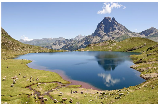
Le Pic du Midi d'Ossau – 2884 m